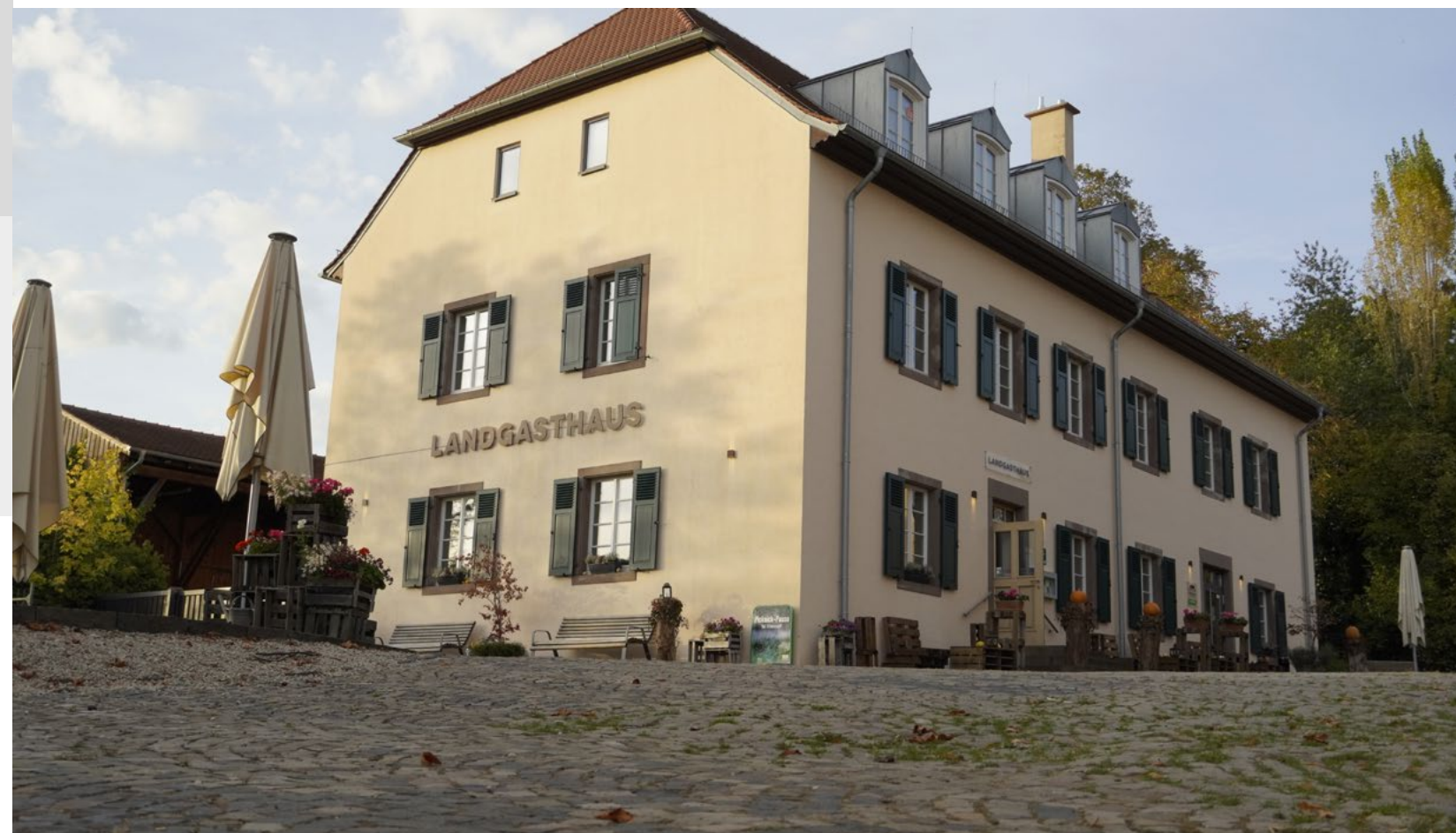
Der Wintringer Hof ist seit 1987 anerkannter Bioland-Betrieb