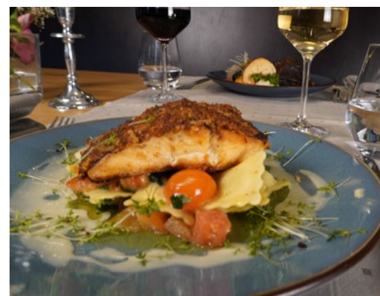
Bon appetit! Im Landgasthaus Wintringer Hof werden feine Bio-Gerichte aufgetischt

Etwa 16 Prozent – insgesamt rund 12.000 Hektar – der saarländischen Weiden und Äcker werden mittlerweile ökologisch bewirtschaftet.