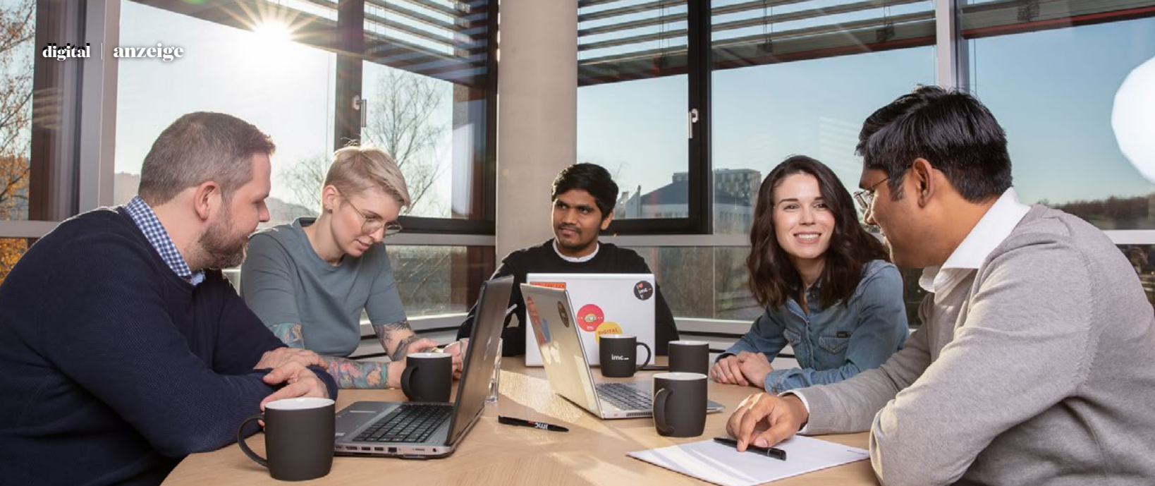
Spannende Projekte, flache Hierarchien, wertschätzendes Miteinander: Bei der imc AG stimmt der Team-Spirit