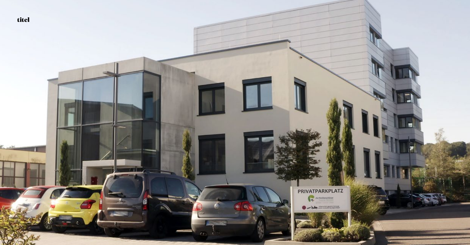
Moderner Komplex: Der Firmensitz der Familienschützer in Neunkirchen wurde erst kürzlich komplett kernsaniert

aus unserer Sicht welche Leistungen wie angepasst werden sollten. Wir bieten keine 08/15-Beratung, sondern erarbeiten für Sie eine Strategie nach Maß, die hundertprozentig zu Ihnen, Ihrer Lebenssituation und Ihren Zielen passt.