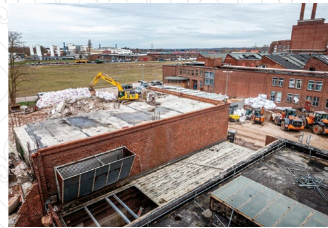
Industriergelände in Heinsberg

Moderne Zeiten: In der Bahnhofstraße entsteht gerade der neue Hauptsitz der Sparkasse Neunkirchen