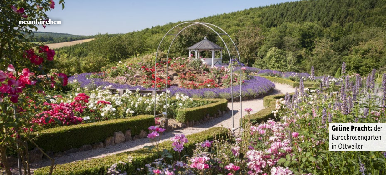
Grüne Pracht: der Barockrosengarten in Ottweiler