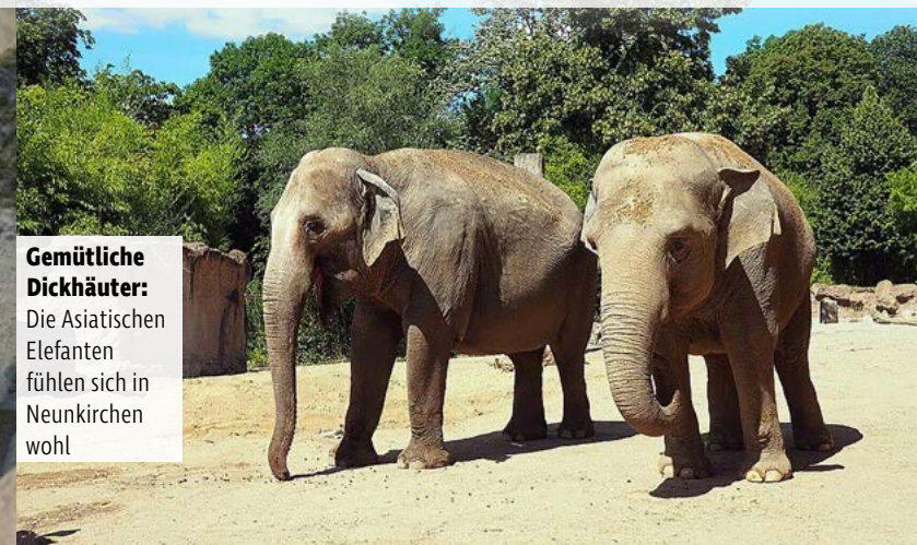
Gemütliche Dickhäuter: Die Asiatischen Elefanten fühlen sich in Neunkirchen wohl