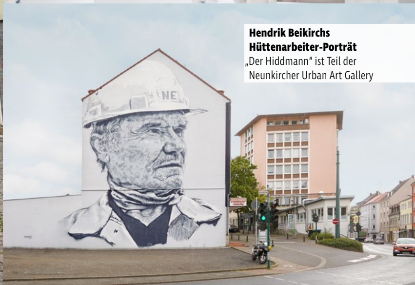
Hendrik Beikirchs Hüttenarbeiter-Porträt „Der Hiddmann“ ist Teil der Neunkircher Urban Art Gallery