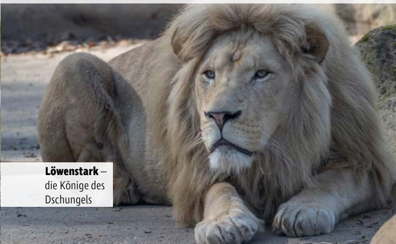
Löwenstark – die Könige des Dschungels