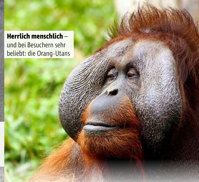
Herrlich menschlich – und bei Besuchern sehr beliebt: die Orang-Utans