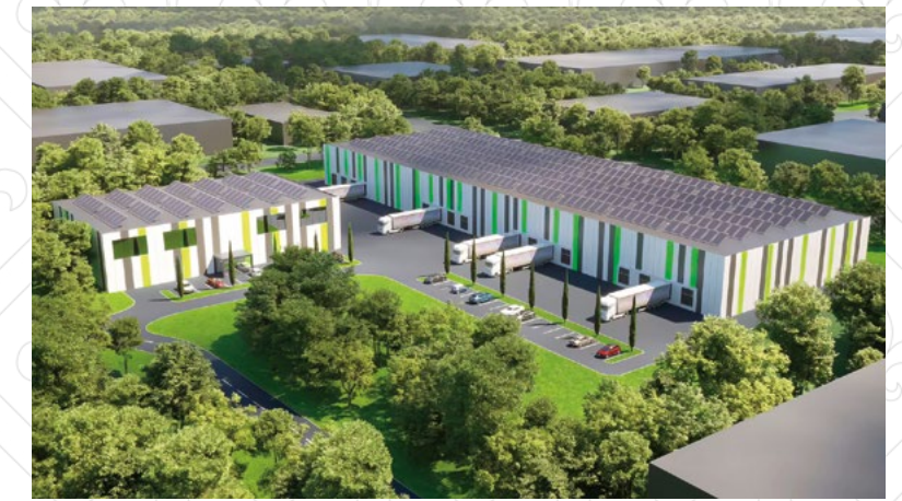
Umsetzung: Fläche für Logistik und Gewerbe