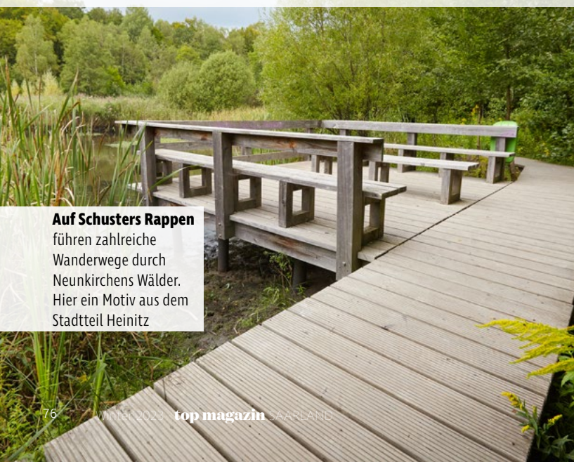
Auf Schusters Rappen führen zahlreiche Wanderwege durch Neunkirchens Wälder. Hier ein Motiv aus dem Stadtteil Heinitz