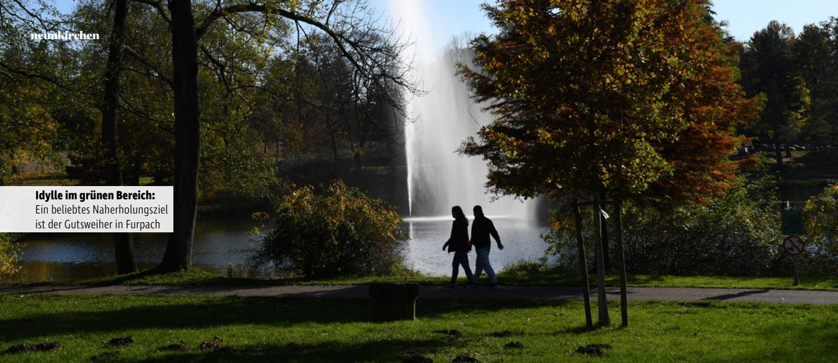
Idylle im grünen Bereich: Ein beliebtes Naherholungsziel ist der Gutsweiher in Furpach