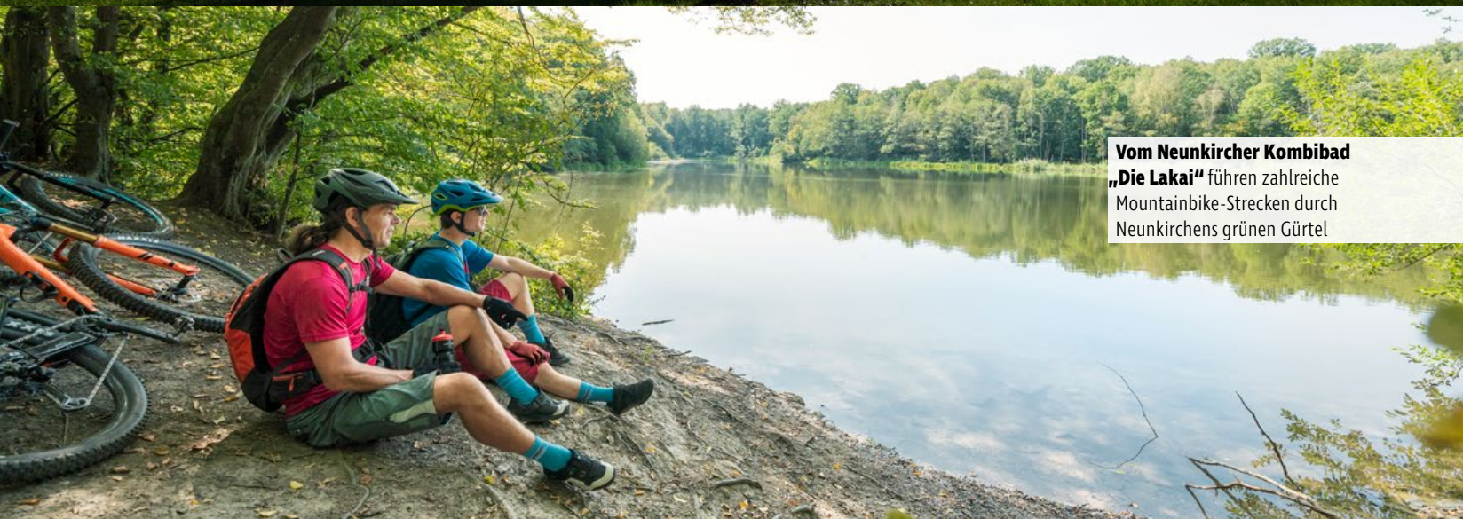
Vom Neunkircher Kombibad „Die Lakai“ führen zahlreiche Mountainbike-Strecken durch Neunkirchens grünen Gürtel