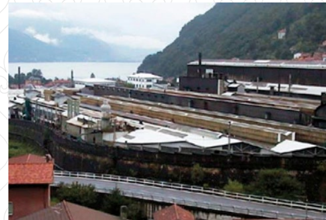
Industriergelände Lago di Como