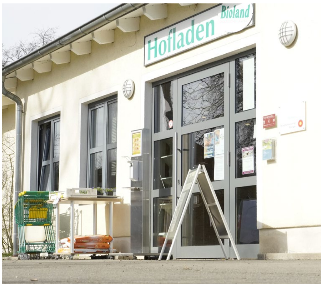
Karotten, Käse, Kichererbsen: Im „Hofladen“ ist alles bio!

Der Wintringer Hof im Biosphärenreservat Bliesgau ist eine Werkstatt für Menschen mit Behinderung der Lebenshilfe Obere Saar e.V. und seit 1987 anerkannter Bioland-Betrieb. 160 Menschen sind hier beschäftigt - in den Bereichen Landwirtschaft, Obstbau, Gemüsebau, Kelterei, Verarbeitung und Vermarktung sowie im Garten- und Landschaftsbau. Eine Mutterkuhherde lebt ebenso auf dem Hof wie Schweine, Hähnchen und Hühner im Hühnermobil.