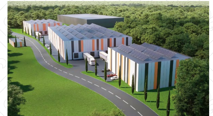
Umsetzung: Fläche für Logistik und Gewerbe