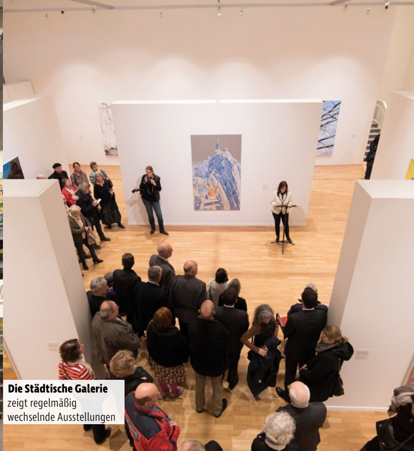
Die Städtische Galerie zeigt regelmäßig wechselnde Ausstellungen