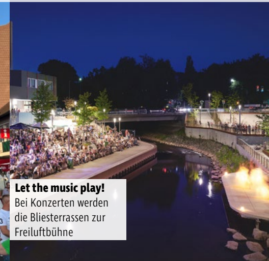
Let the music play! Bei Konzerten werden die Bliesterrassen zur Freiluftbühne