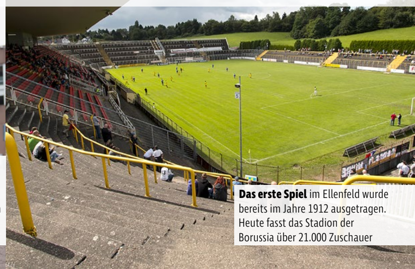
Das erste Spiel im Ellenfeld wurde bereits im Jahre 1912 ausgetragen. Heute fasst das Stadion der Borussia über 21.000 Zuschauer