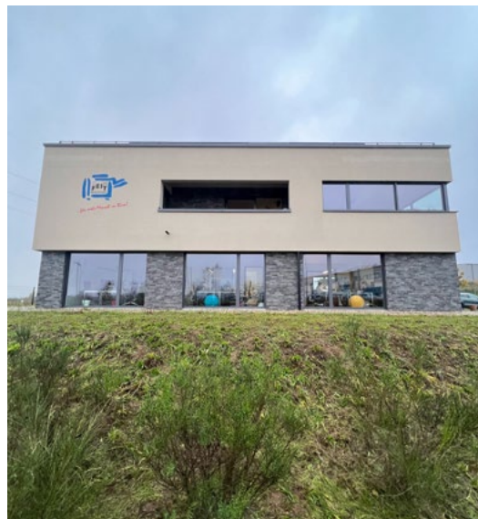
Firmensitz der Heim+Feit GmbH auf dem Lisdorfer Berg

Es ist entscheidend, die individuellen Bedürfnisse und Arbeitsabläufe eines Unternehmens zu verstehen. Unsere Experten bei Heim+Feit führen auf Wunsch da zunächst eine gründliche Analyse in Ihrem Betrieb durch. Auf dieser Grundlage zeigen wir danach gerne auf, welche Prozesse digitalisiert werden können und welche besser in analoger Form bleiben sollten. Es geht darum, maßgeschneiderte Lösungen zu finden, die die Effizienz steigern, ohne bewährte Arbeitsweisen über Bord zu werfen. So können Sie in Ruhe selbst entscheiden, welche Geräte und Technologien sie mieten, kaufen oder leasen wollen. Ob Multifunktionsgeräte, Digitale Whiteboards oder Dokumentenmanagement-Systeme – Wir beraten, Sie entscheiden! ■