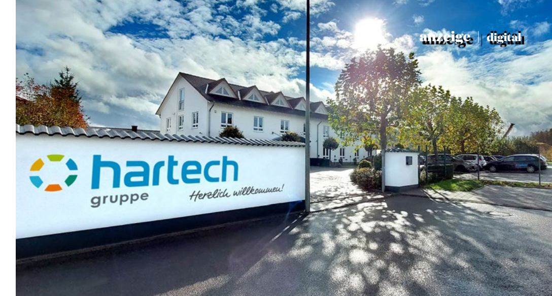
Hauptsitz der hartech Gruppe in Rehlingen-Siersburg

dieser deutschlandweiten und branchenübergreifenden Aktion. Besonders stolz ist man, dass im Saarland nur zwei Unternehmen in der Statistik der IT-Unternehmen aufgeführt werden. hartech nimmt hierbei mit durchschnittlichem