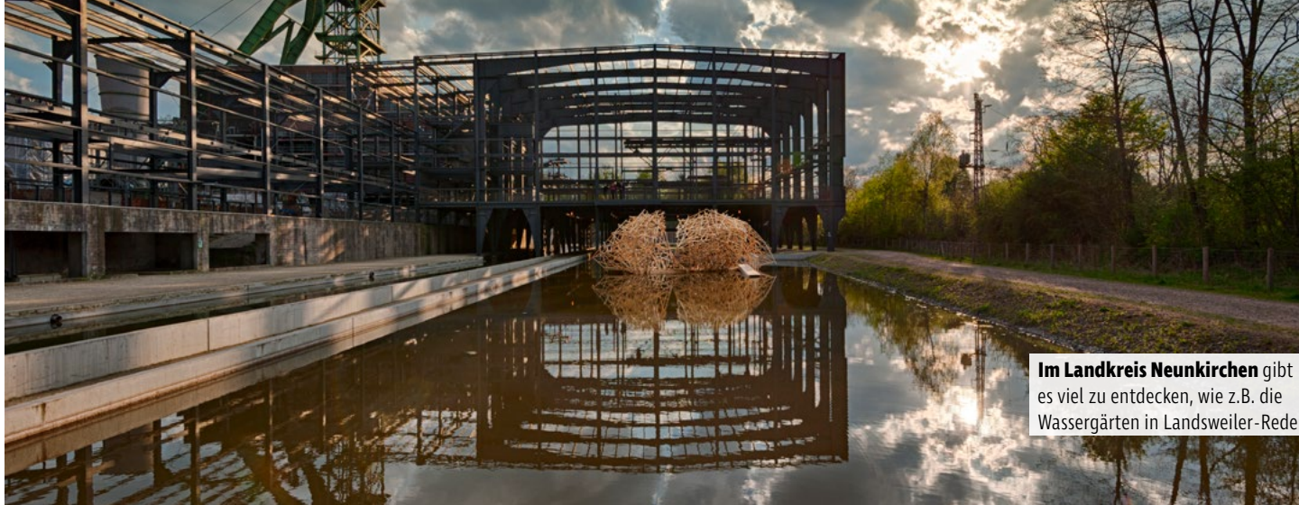
Im Landkreis Neunkirchen gibt es viel zu entdecken, wie z.B. die Wassergärten in Landsweiler-Reden