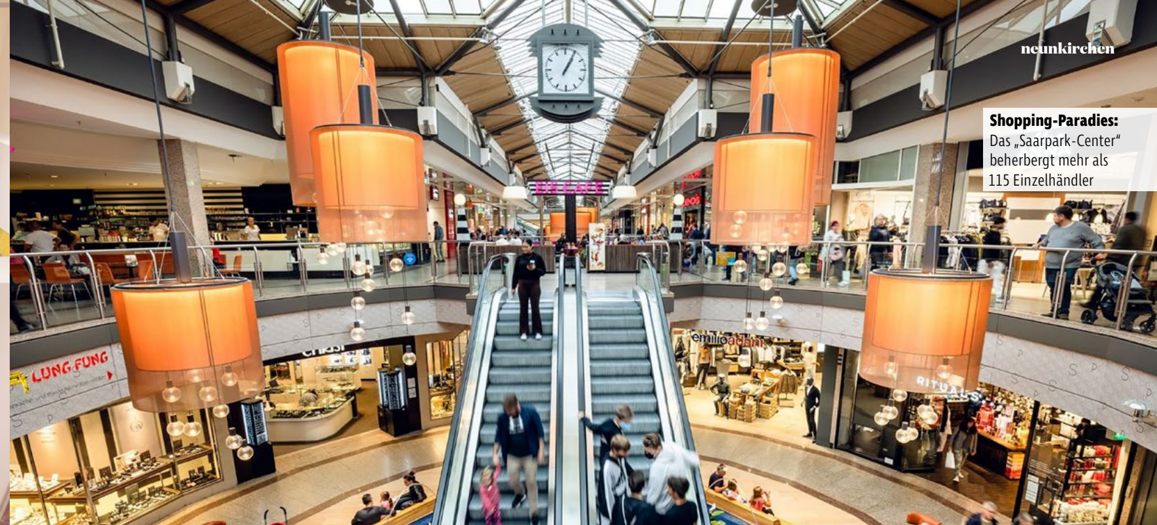
Shopping-Paradies: Das „Saarpark-Center“ beherbergt mehr als 115 Einzelhändler