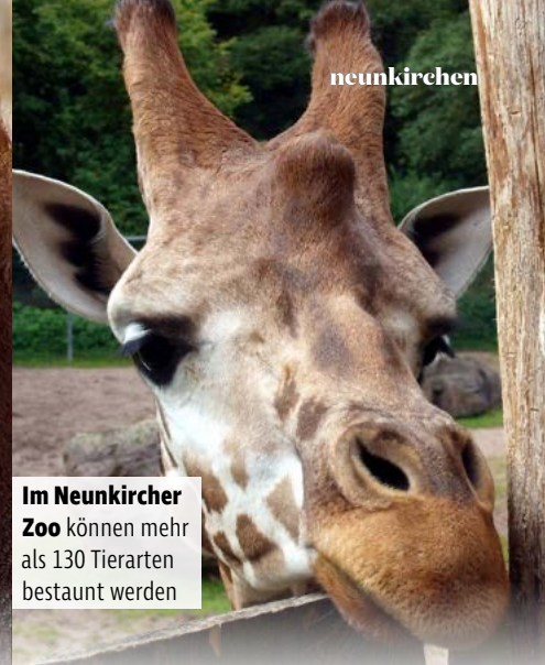
Im Neunkircher Zoo können mehr als 130 Tierarten bestaunt werden