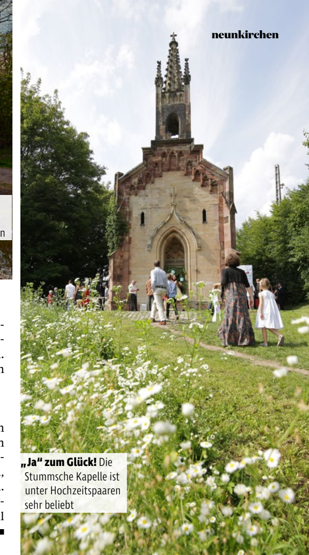
„Ja“ zum Glück! Die Stummsche Kapelle ist unter Hochzeitspaaren sehr beliebt