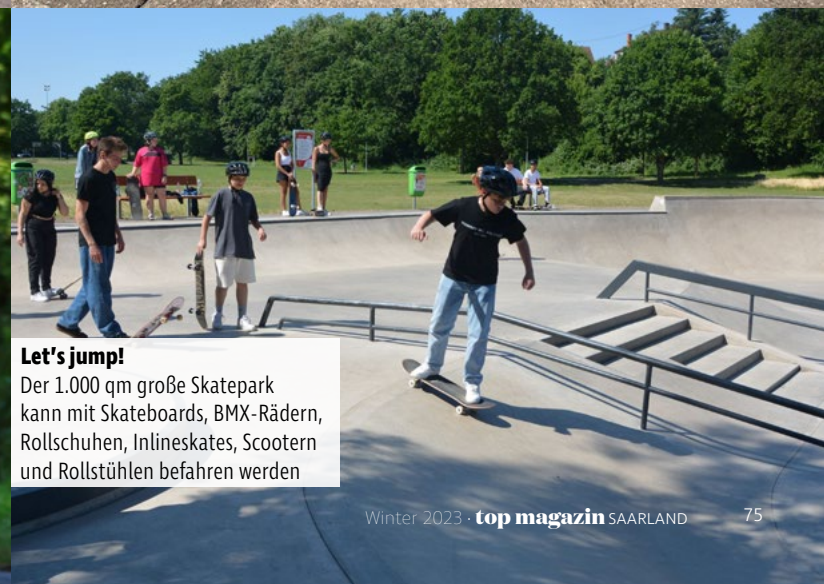
Let's jump! Der 1.000 qm große Skatepark kann mit Skateboards, BMX-Rädern, Rollschuhen, Inlineskates, Scootern und Rollstühlen befahren werden