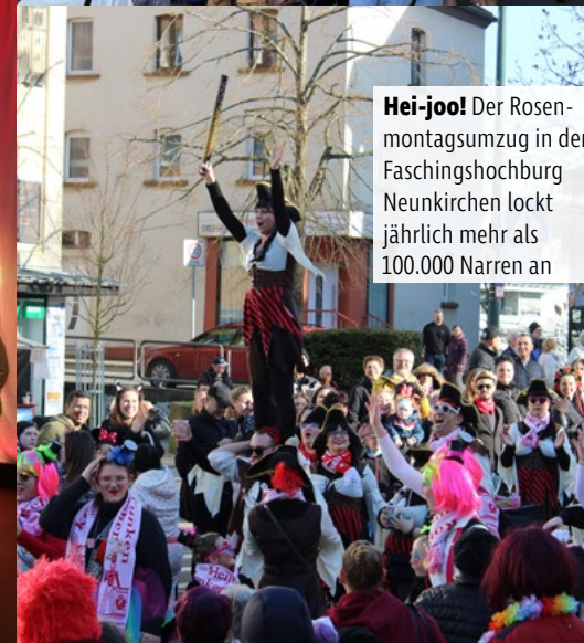
Hei-jool! Der Rosenmontagszug in der Faschingshochburg Neunkirchen lockt jährlich mehr als 100.000 Narren an