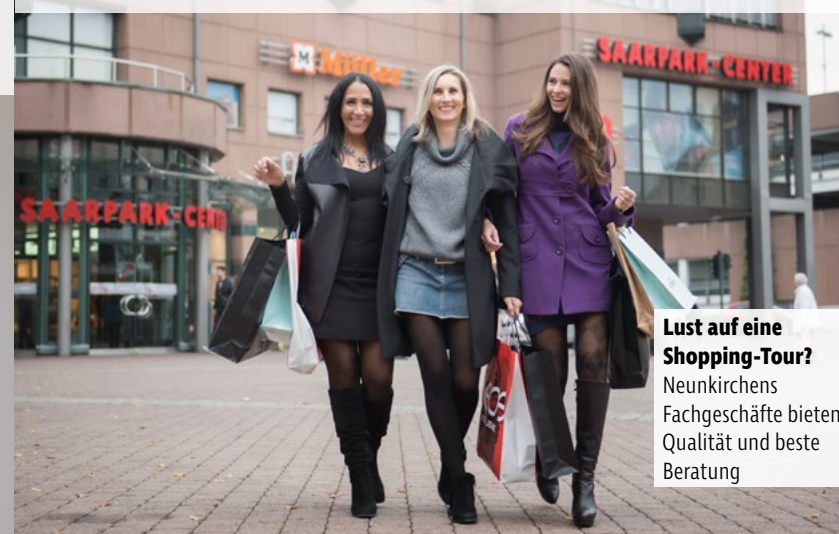
Lust auf eine Shopping-Tour? Neunkirchens Fachgeschäfte bieten Qualität und beste Beratung