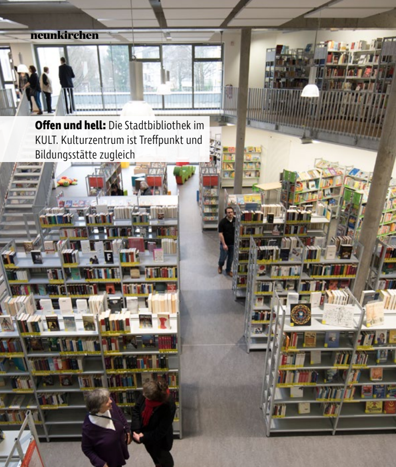
Offen und hell: Die Stadtbibliothek im KULT. Kulturzentrum ist Treffpunkt und Bildungsstätte zugleich