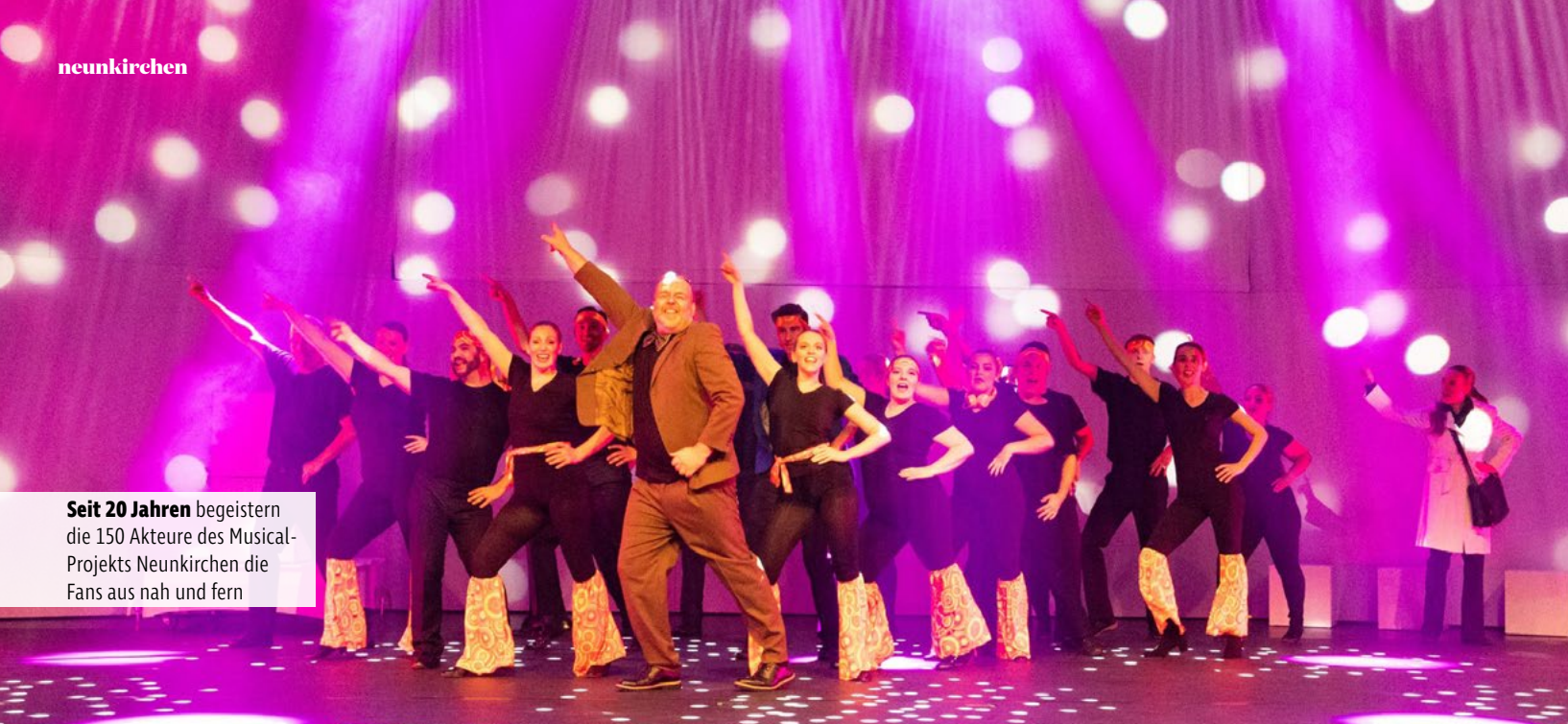
Seit 20 Jahren begeistern die 150 Akteure des Musical-Projekts Neunkirchen die Fans aus nah und fern