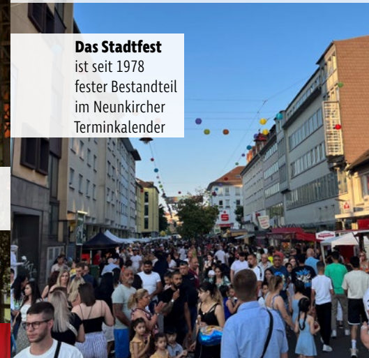
Das Stadtfest ist seit 1978 fester Bestandteil im Neunkircher Terminkalender