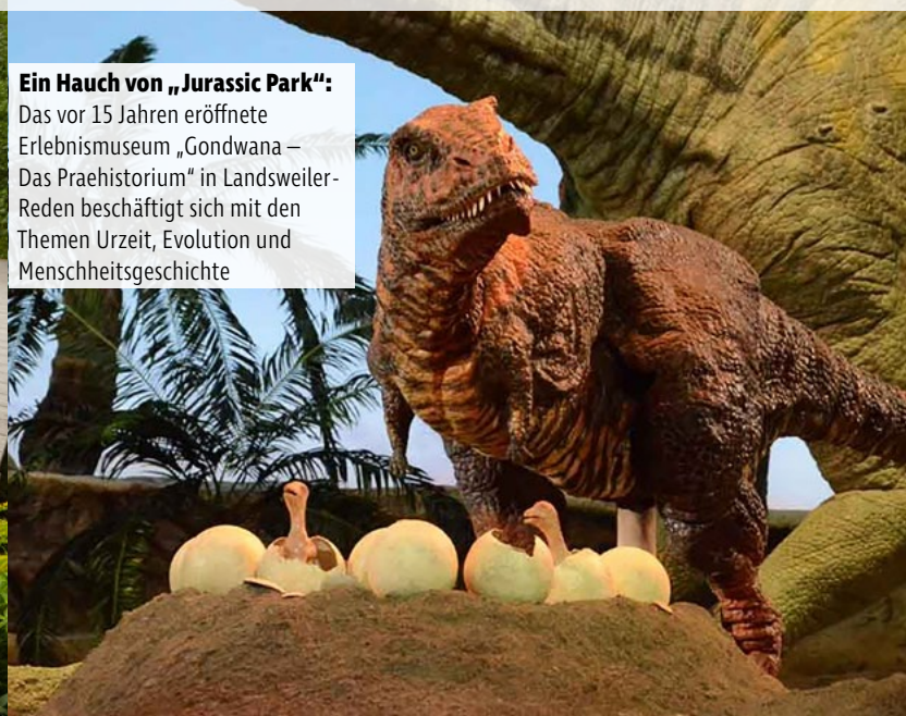
Ein Hauch von „Jurassic Park“: Das vor 15 Jahren eröffnete Erlebnismuseum „Gondwana – Das Praehistorium“ in Landsweiler-Reden beschäftigt sich mit den Themen Urzeit, Evolution und Menschheitsgeschichte