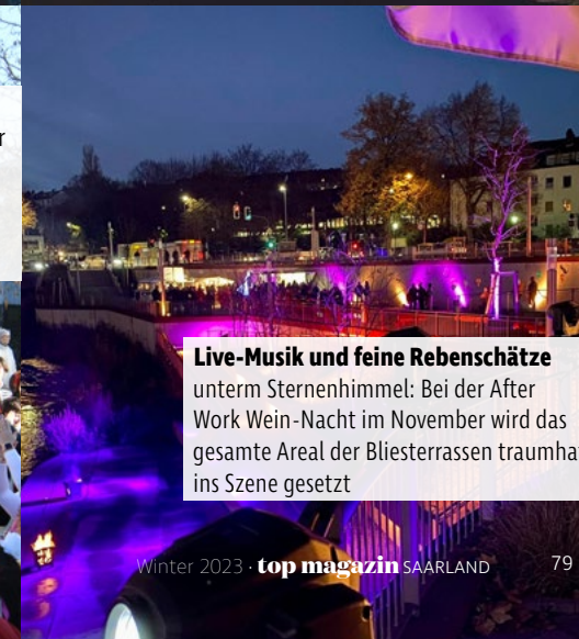
Live-Musik und feine Rebenschätze unterm Sternenhimmel: Bei der After Work Wein-Nacht im November wird das gesamte Areal der Bliesterrassen traumhaft ins Szene gesetzt

Die saarländische Küche hat ein Zuhause!