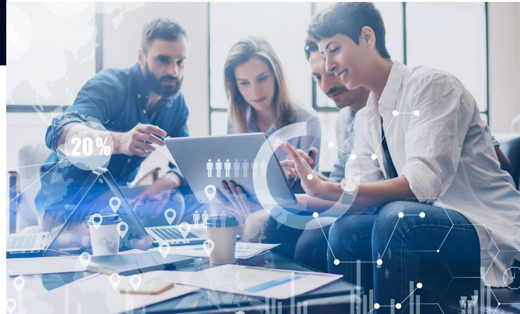
Ob Business oder Privatleben: Die Transformation durchdringt alle Lebensbereiche