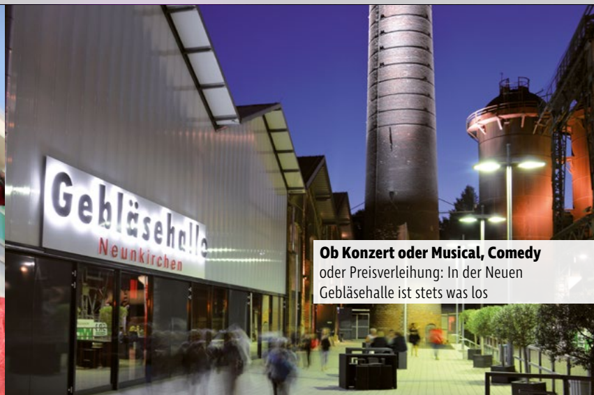
Ob Konzert oder Musical, Comedy oder Preisverleihung: In der Neuen Gebläsehalle ist stets was los