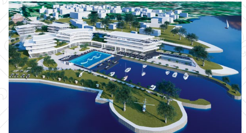
Umsetzung: Hospitality und Tourismus