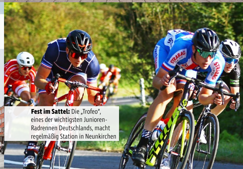
Fest im Sattel: Die „Trofeo“, eines der wichtigsten Junioren-Radrennen Deutschlands, macht regelmäßig Station in Neunkirchen