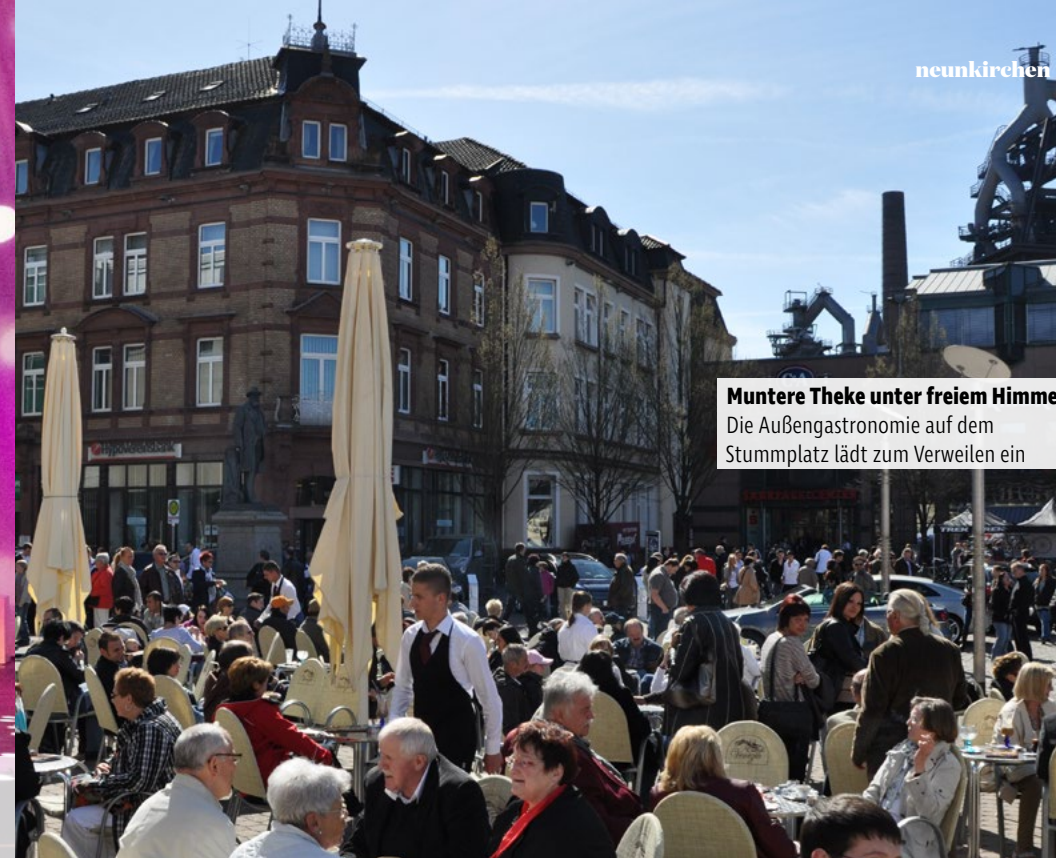
Muntere Theke unter freiem Himmel: Die Außengastronomie auf dem Stummplatz lädt zum Verweilen ein