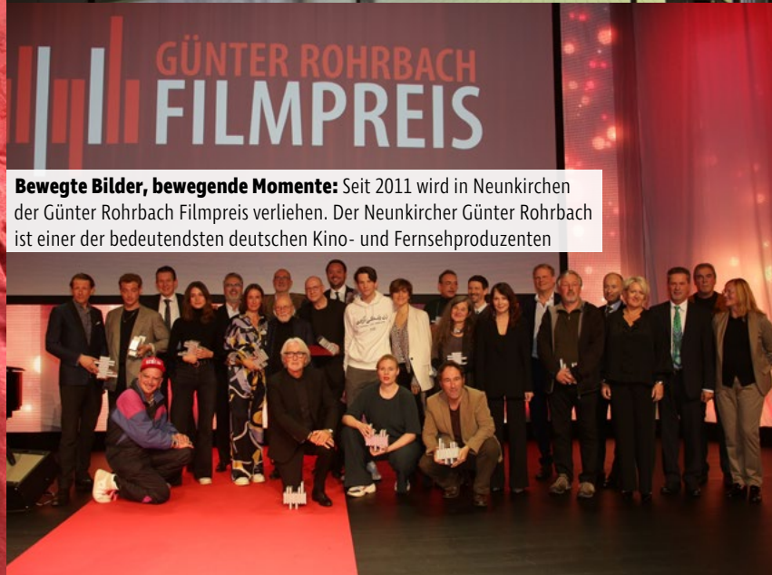
Bewegte Bilder, bewegende Momente: Seit 2011 wird in Neunkirchen der Günther Rohrbach Film Preis verliehen. Der Neunkircher Günther Rohrbach ist einer der bedeutendsten deutschen Kino- und Fernsehproduzenten