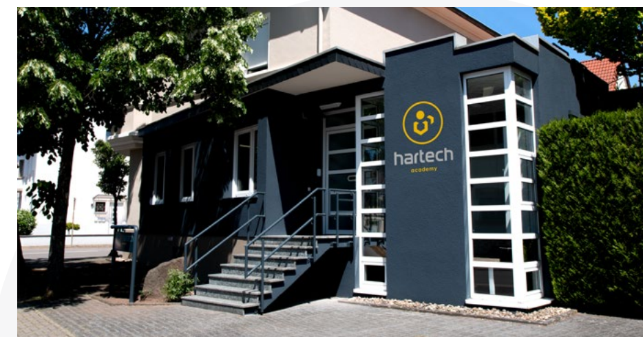
hartech Academy in Dillingen Pachten

Das renommierte Magazin Focus Business hat gemeinsam mit der Online-Plattform Statista, die Daten aus Markt- und Meinungsforschungsinstituten zugänglich macht, hartech zum Wachstumschampion 2024 gewählt. Damit gehört hartech zu den 500 erfolgreichsten Unternehmen