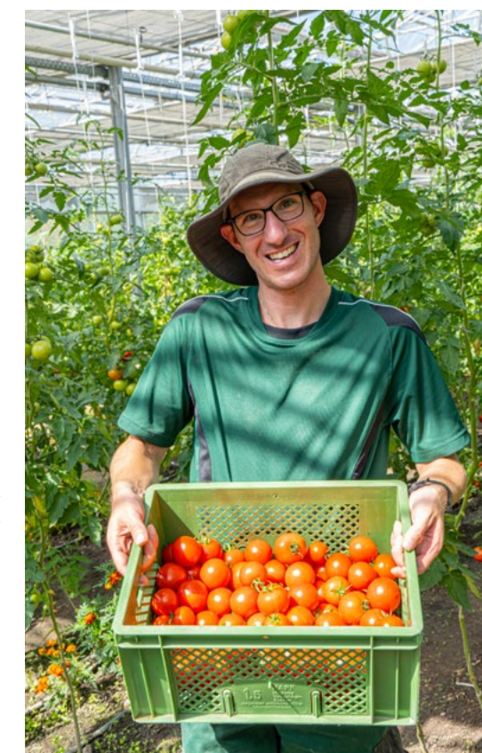
Neue Ernte: Die Tomaten vom Bioland-Betrieb „Wintringer Hof“ sind einfach köstlich